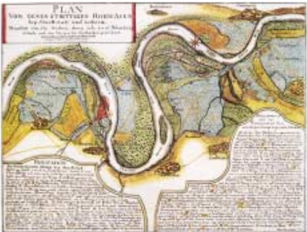
Peter Fehr, 1738

Das Naturschutzgebiet bildet den größten zusammenhängenden naturnahen Auekomplex am Oberrhein.